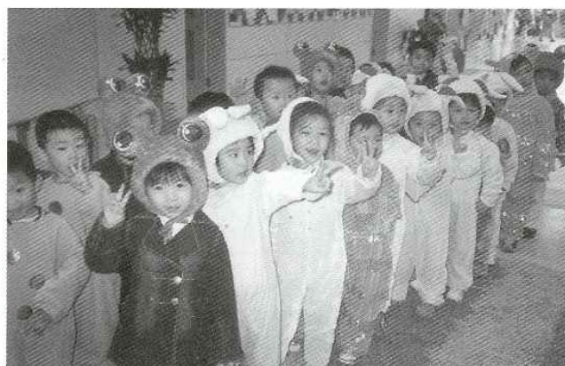
Børnene skal lave opvisning for deres forældre og indbyrdes dyste med de andre klasser om, hvem der er bedst. Vi danske lærere blev udnævnt til dommere og skulle dømme efter skalaen 'good, better, best'. Vi syntes selvfølgelig, de alle sammen var noget så søde og dygtige, og at de alle sammen fortjente en præmie.

Således kan selv den mest velmente handling få katastrofale konsekvenser for både børnene og lærerne. Derfor gør jeg ret hurtigt op med mig selv, at mit job er at lære børnene engelsk og at give dem nogle sjove oplevelser.