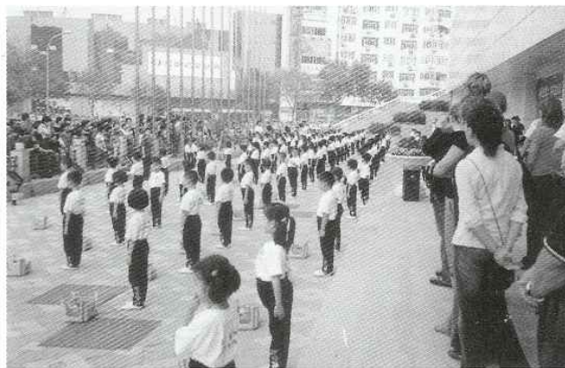
Børnehaveklassens daglige »morgengymnastik«. Denne dag overværes den af forældrene.

Vi havde regnet med at få et par dage til at komme os over jetlag og vænne os til de nye omgivelser. Skolens leder har dog helt andre travle planer, og vi starter allerede med at arbejde knap et døgn efter, at vi har sat vores fødder på kinesisk jord.