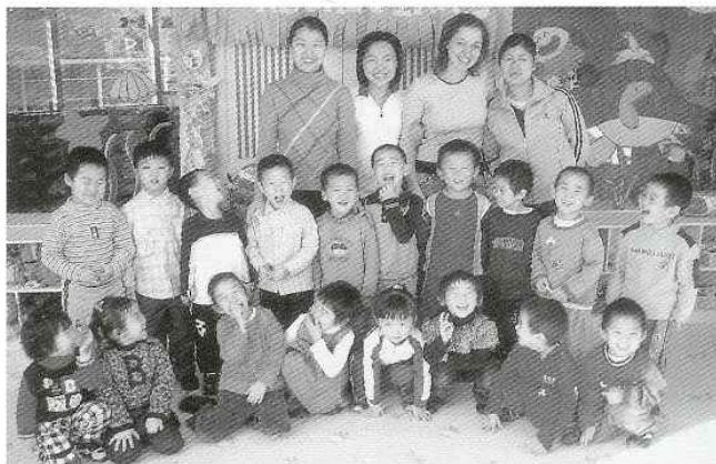
Min klasse. En del af børnene er ikke i skole i dag, hvilket betyder, at lærerne får mindre i løn. Lederen mener ikke, der er så meget arbejde at lave, når der er færre børn.