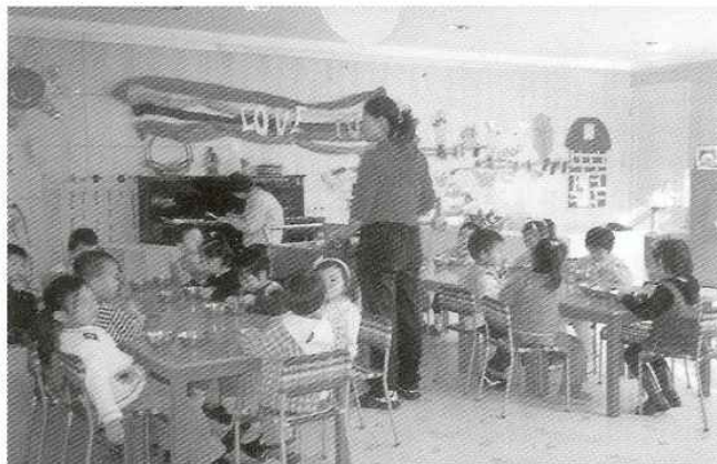
Mit klasselokale. Børnene spiser frokost.

dighedstræning, gå pænt på række og så selvfølgelig engelsk.