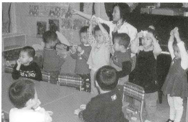
De dygtigste bliver fremhævet i Kina. Her belønnes dem, der er bedst til at synge en bestemt sang.