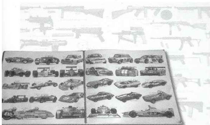
Bøger fra børnenes læsehjørne.